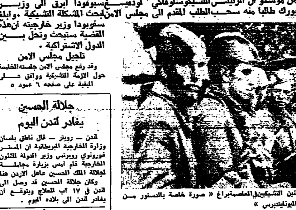
الجنود السوفيات يحرسون مواقعهن في وجه المواطنين التشيكيين في المصايف

تفتد الامير حسن الجبهة الاردنية عمان - امضى سمو الامير حسن لقب جلالة الملك ولي العهد المقدم صباح يوم امس في تقديس الجبهة الاردنية في منطقة وقف اطلاق النار من الشمال حتى نهاية القفصة الوسطى وزيارة عدد من المدن والقرى لتفتد احوال المواطنين والاطمئنان عليهم. وقد شملت زيارة سموه مدينة اربد ومواقع ام قيس وديبر ابو سعيد والافوار الشمالية. وكان سموه يجتمع خلال ذلك كله بالمسؤولين والمواطنين ويستمع الى اراءهم ومشاهيرهم ويندي توجيههم بشأنها. وقد بدأت الزيارة السلبية في ساعة مبكرة من صباح امس وانتهت في ساعة متأخرة من الليل.